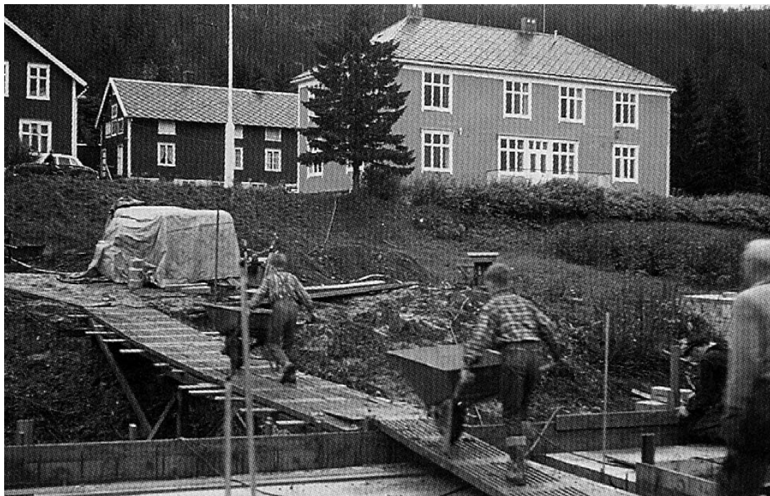
BYGGESTART. Elevene hjelper til under bygging av skolens første internat på tidlig 60-tall.

I sin artikkel skriver de to rektorene at den innebygde konflikten, eller paradokset, som ligger i å samle mange problembelastede ungdommer på ett sted, alltid vil være der. Negativ påvirkning, ut-